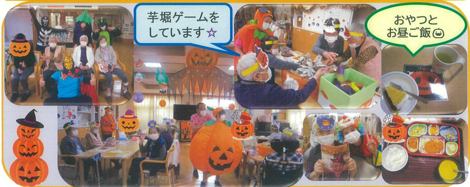
芋堀ゲームをしています☆