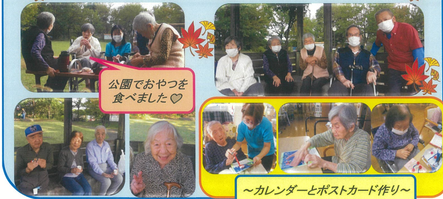
公園でおやつを食べました♡